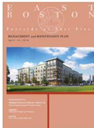
Plan de gestión para un local en East Boston.

La rotulación debería animar a las personas a usar los servicios ofrecidos. El número de letreros, dónde se colocan y qué deben decir se especifica en el plan de gestión del local. Si los titulares de licencias de vías navegables no ofrecen una rotulación adecuada para informar a la gente de la disponibilidad de espacios públicos, por ejemplo, la ubicación y el horario de los baños públicos, estarían violando el plan o la licencia. Lamentablemente, muchos locales de Massachusetts no cumplen con los requisitos de rotulación (obsérvese que en Boston, los letreros del Harborway son diferentes de los requeridos por el Reglamento de Vías Navegables). Además, los requisitos mínimos de rotulación del MassDEP están en su página de internet [VER RECURSOS EN LA PÁG. 27 CON LAS DIRECCIONES DE INTERNET].