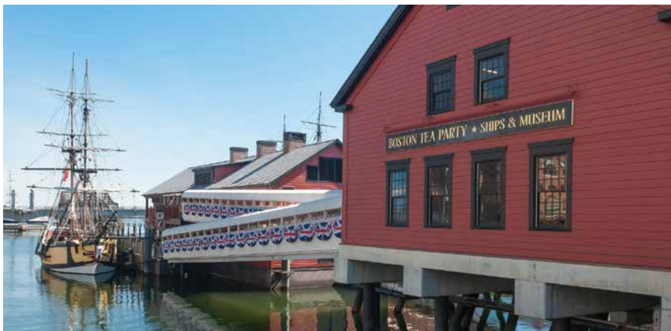
El Museo del Boston Tea Party yace sobre pilares existentes.