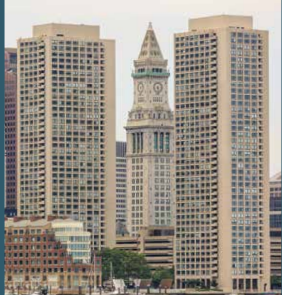
Los condominios Harbor Towers no cumplen con el Reglamento de Vías Navegables porque fueron construidos antes de que la ley actual entrara en vigor.

Por ejemplo, los condominios Harbor Towers fueron autorizados por la legislatura estatal y se construyeron en 1971. Sin embargo, si se cambia el tipo de uso de tal estructura o localización exenta, por ejemplo, convirtiendo los condominios en oficinas, o si la estructura es modificada de manera sustancial, se necesitaría una licencia de acuerdo con el Reglamento de Vías Navegables actual.